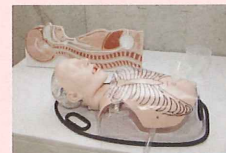
経管栄養シミュレーターも完備

単科校にしかできない最高の実習施設を備えています。充実した学びの環境で、経験豊富な教員がリアルな授業を行い、介護の現場で活躍できる介護福祉士を目指せます。